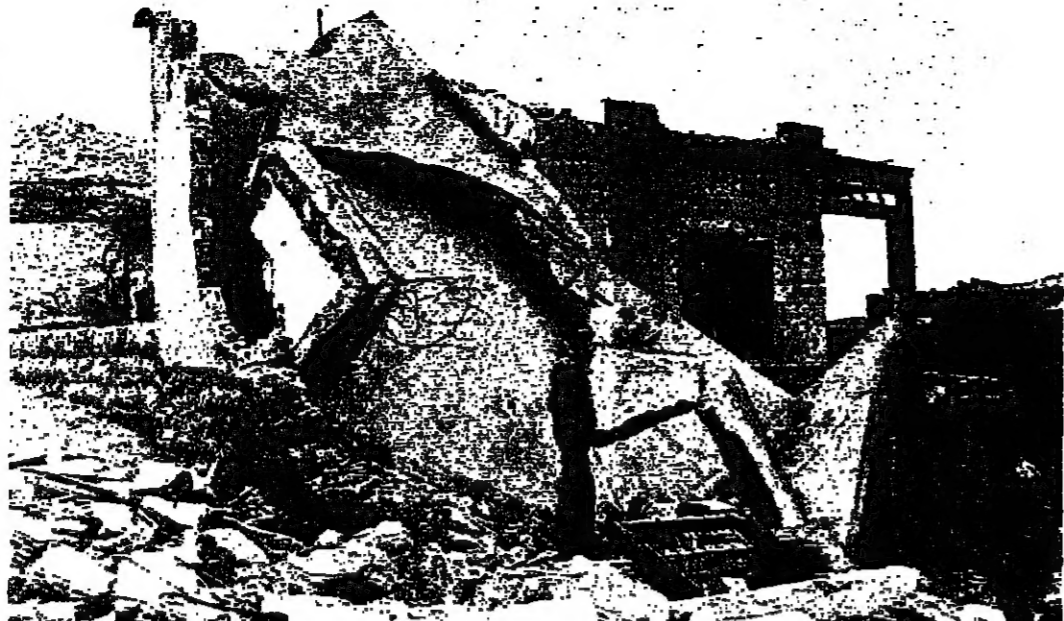
منزل مدمر النصف الاسرائيلي في كفرشوبا

في وجه كل الضغوط، واتسع اهلي كفرشوبا خاصة الجنوب عليه بعيدا عن كل الزلازل.